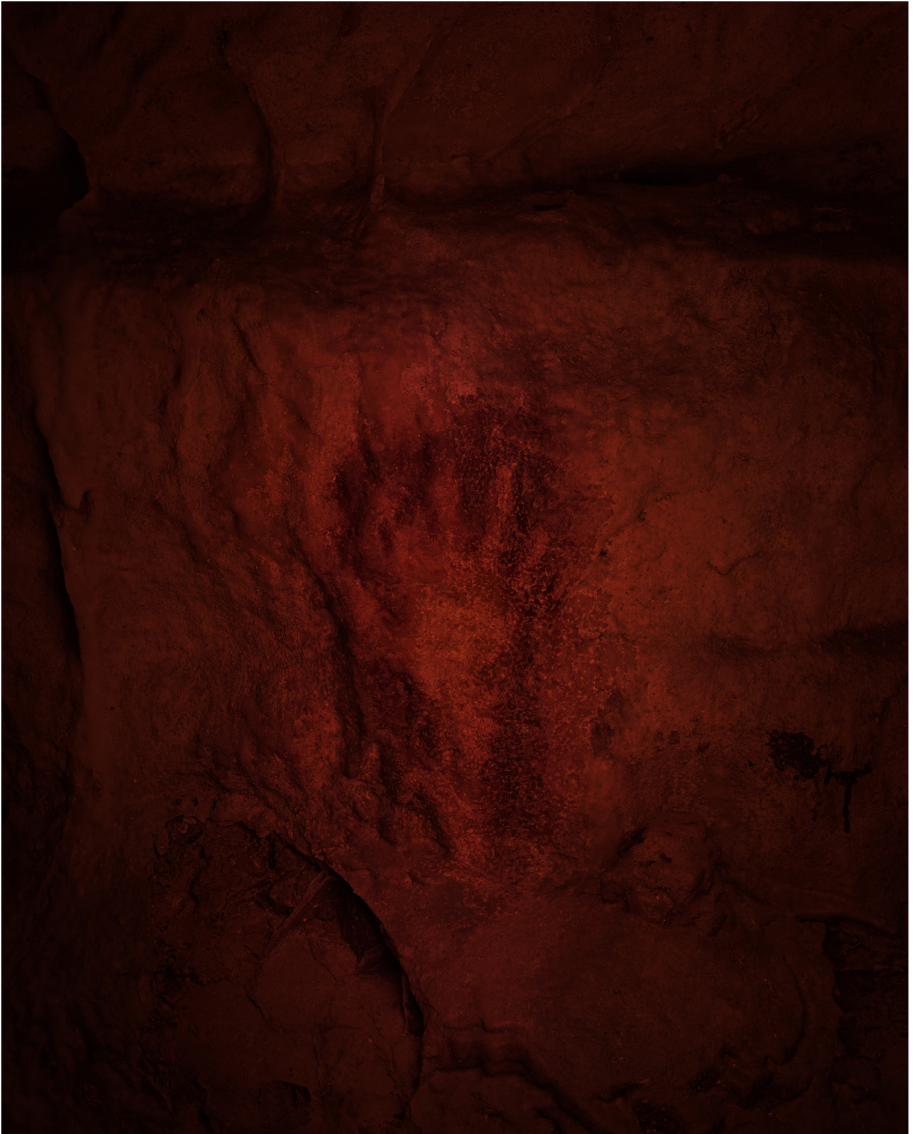
Juliette Agnel, La Main de l'enfant , Arcy-sur-Cure, France, 2023