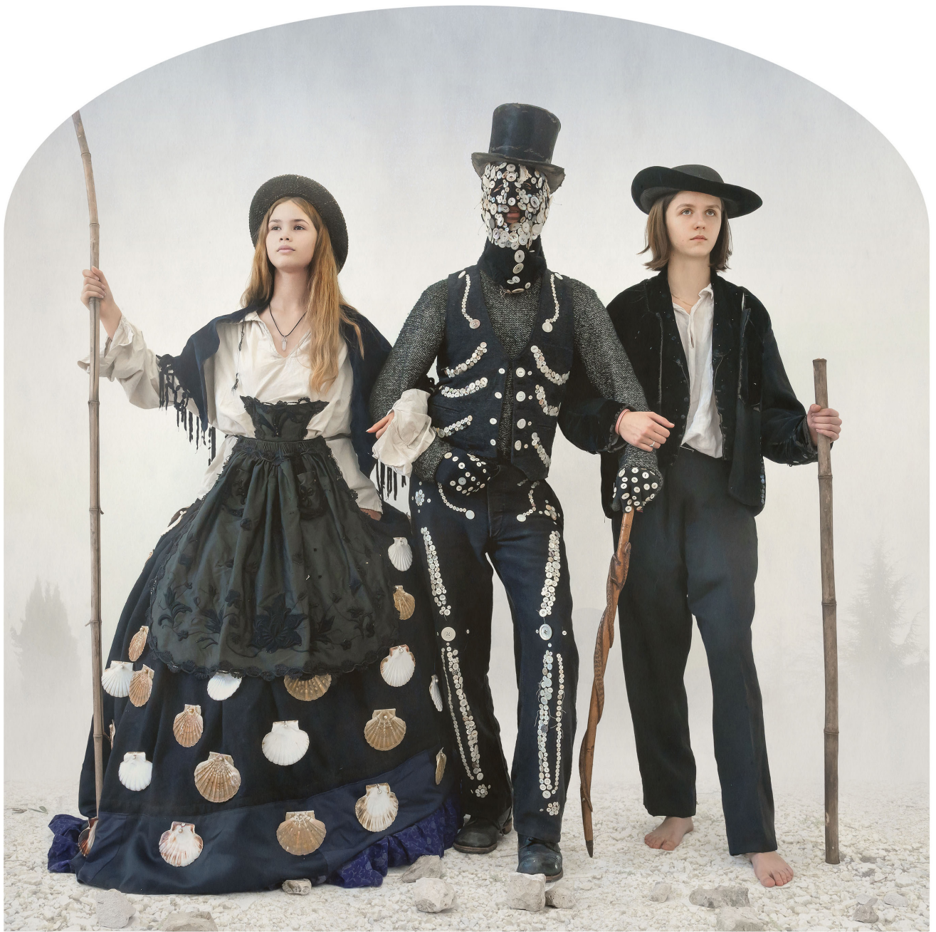
Kahn & Selesnick, projet en cours