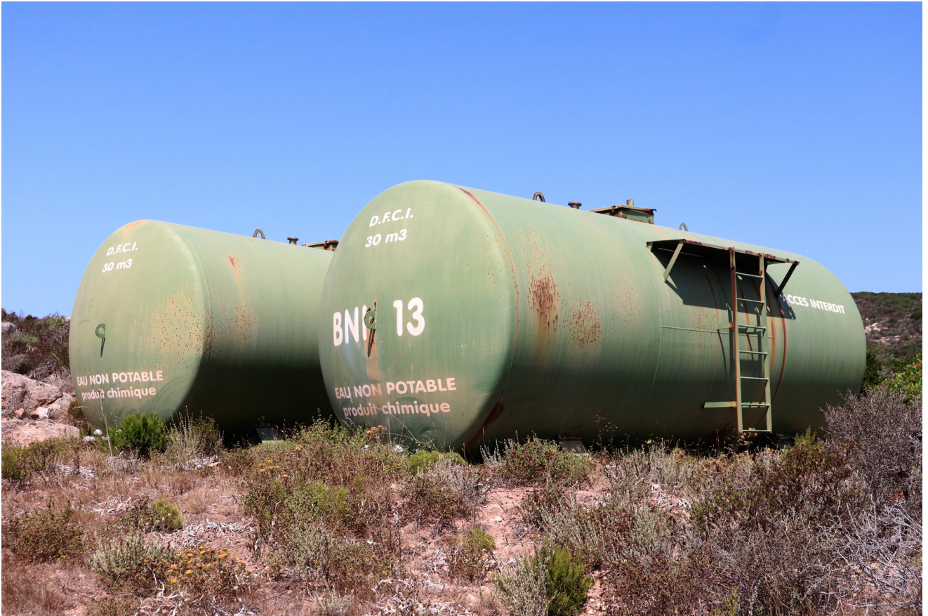
Lou Sémété, PVO/SGC/BNI/ZZA, 2023 © Lou Sémété