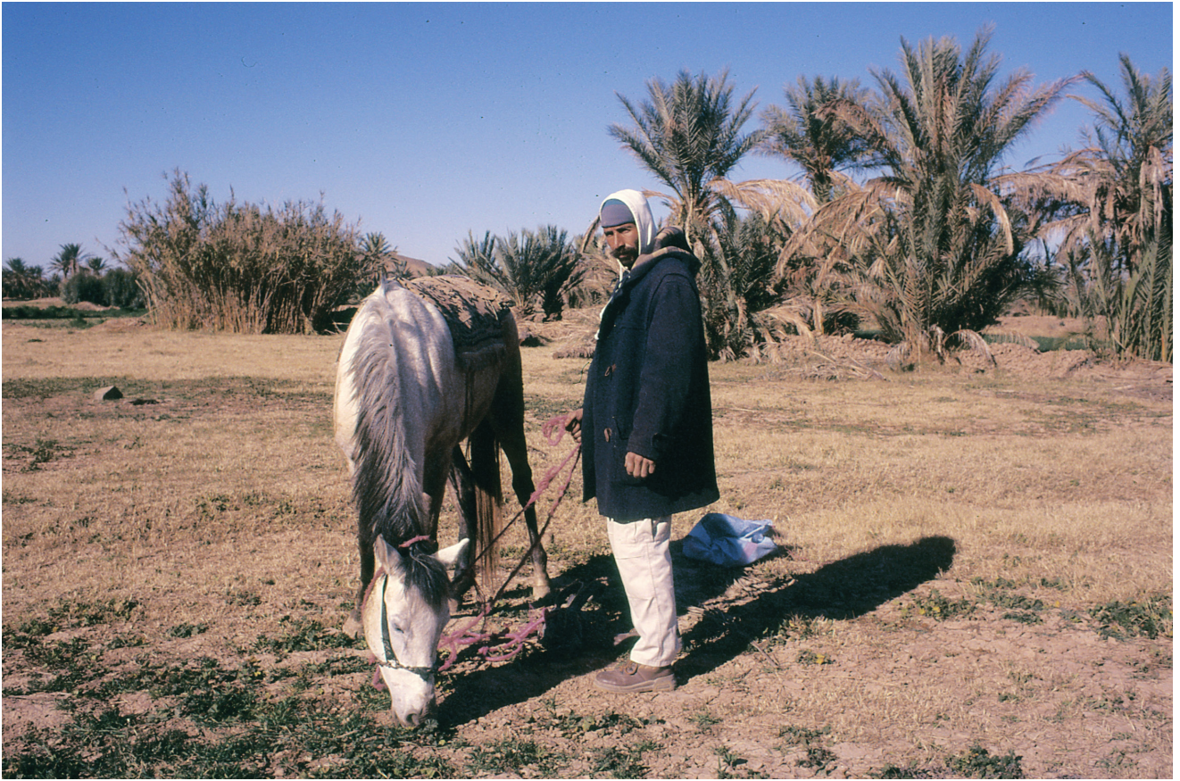
Driss Aroussi, El haouda o moulaha , 2017 © ADAGP / Driss Aroussi