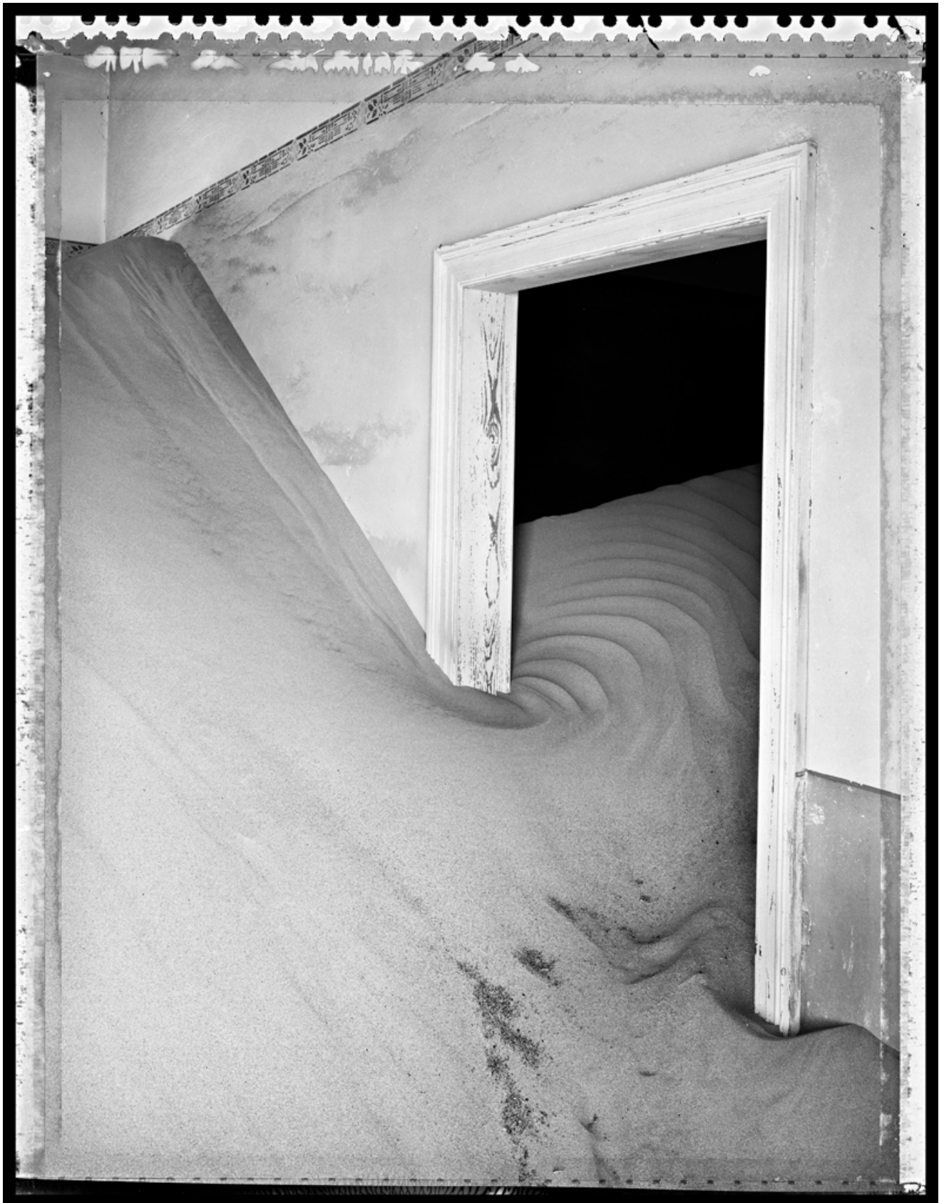
Elaine Ling, Adandoned, Namib Desert , 2016 © Elaine Ling - Courtoisie galerie Vu', Paris