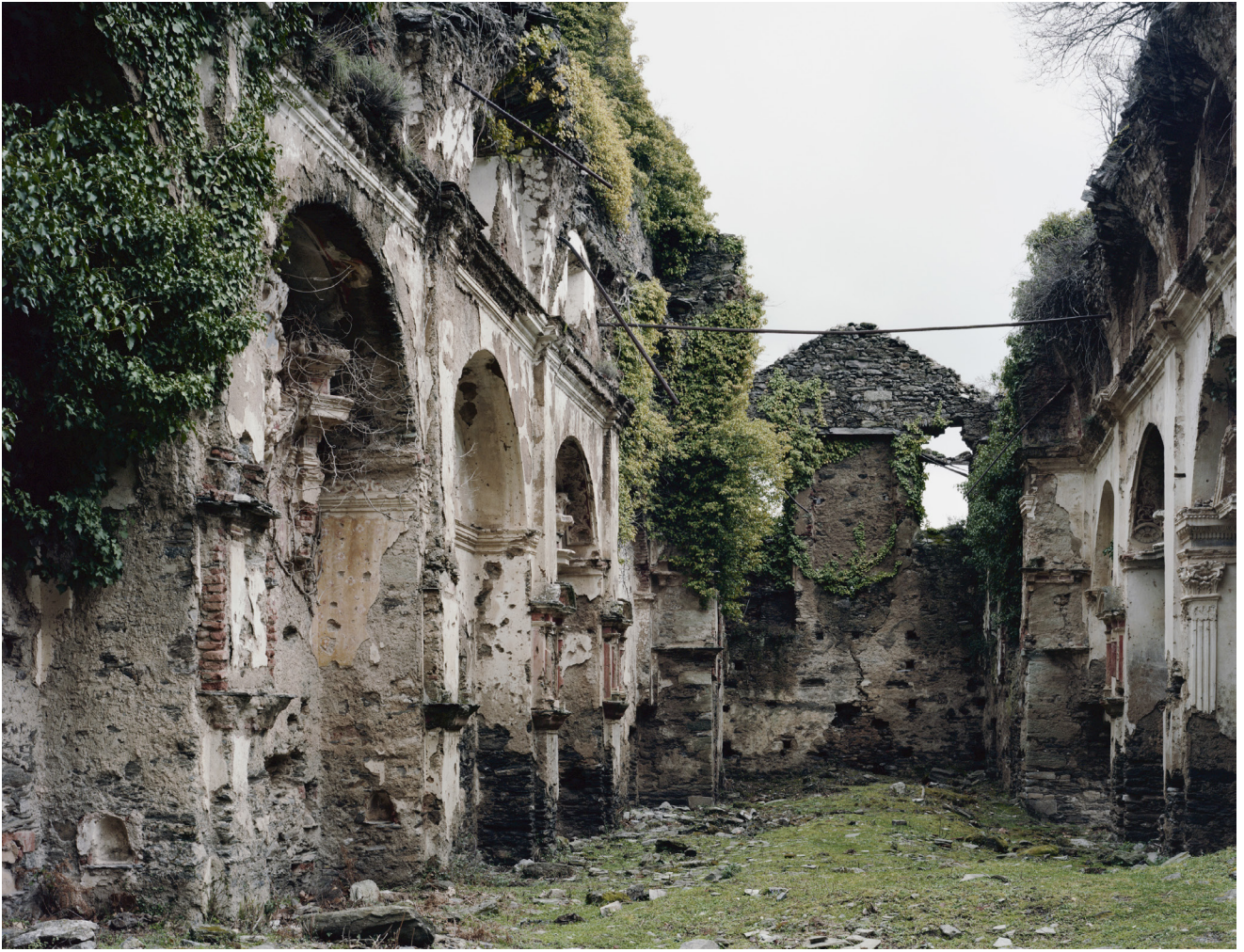
Lea Eouzan-Pieri, Tomba – Cunventu , 2017 © Lea Eouzan-Pieri