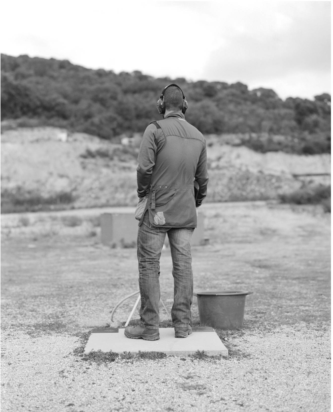
Yan Leandri, série Fucilu cintu , #1, 2022 © Yan Leandri