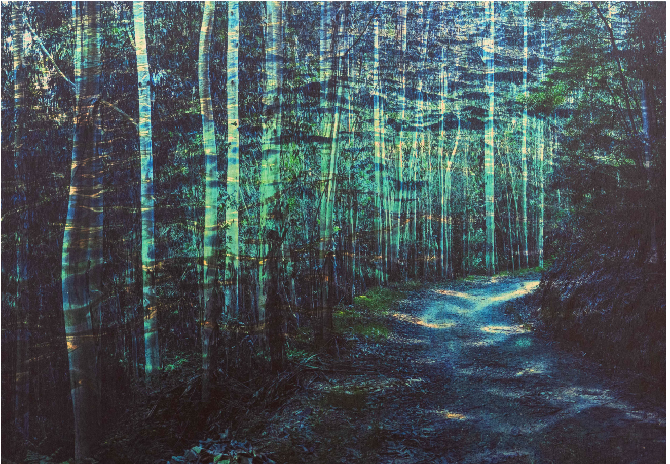
Esmeralda Da Costa, Viagem , 2024 © Esmeralda Da Costa