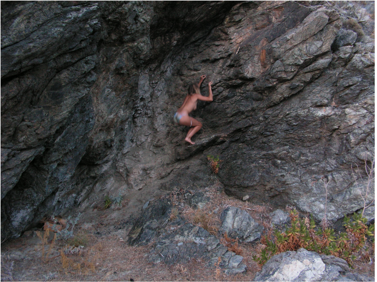
Mattea Riu, Sans titre , 2022 © Mattea Riu