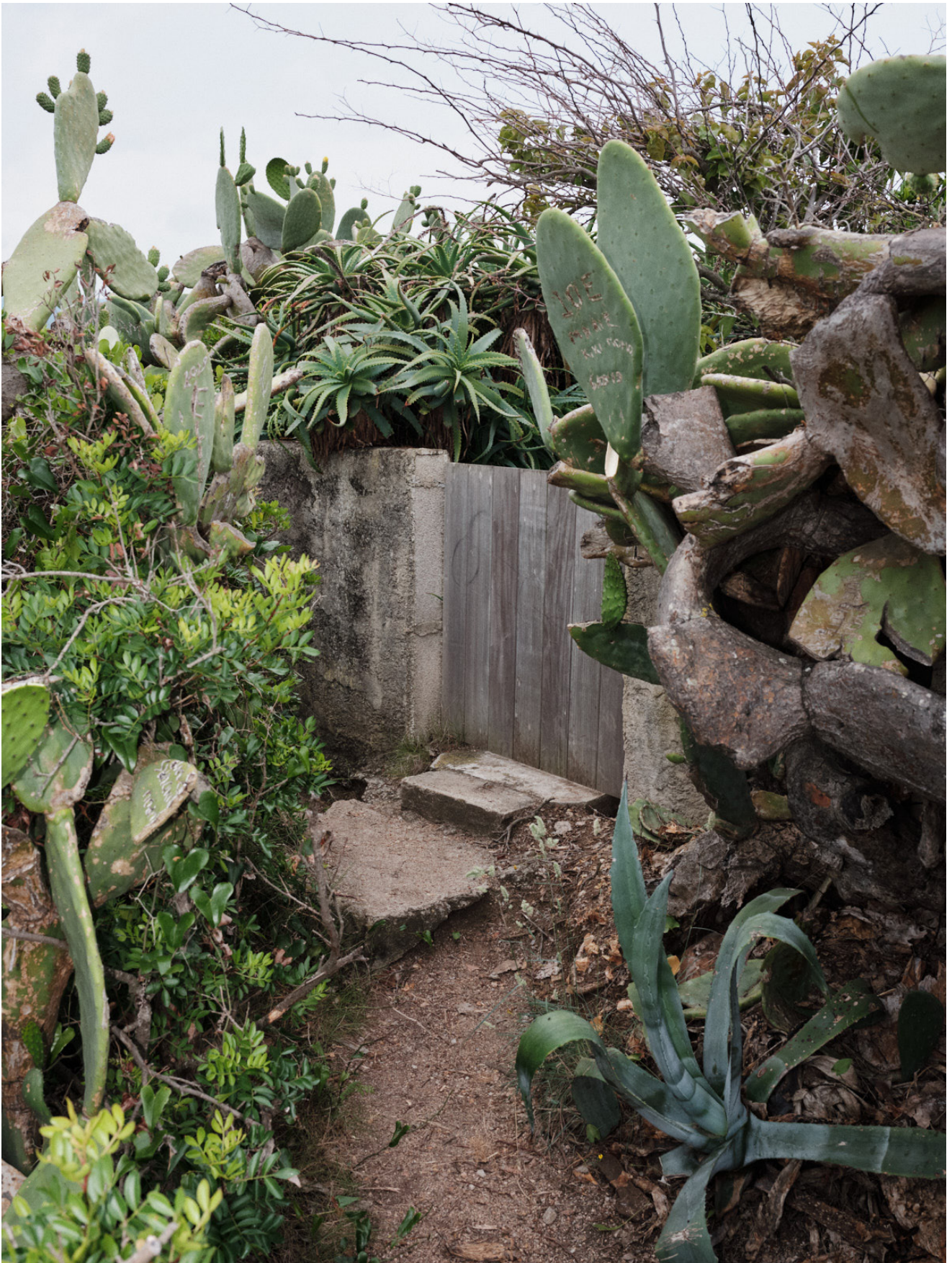
Sébastien Arrighi, Ora , 2019 © ADAGP / Sébastien Arrighi