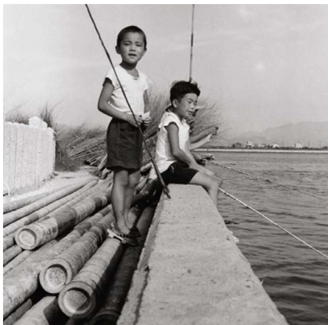
Emmanuelle Riva, "Tu n'as rien vu à Hiroshima"