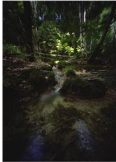
« Ronald Courchod : paysage » - paysage_urbain, vision subjective du jour - Photo de presse