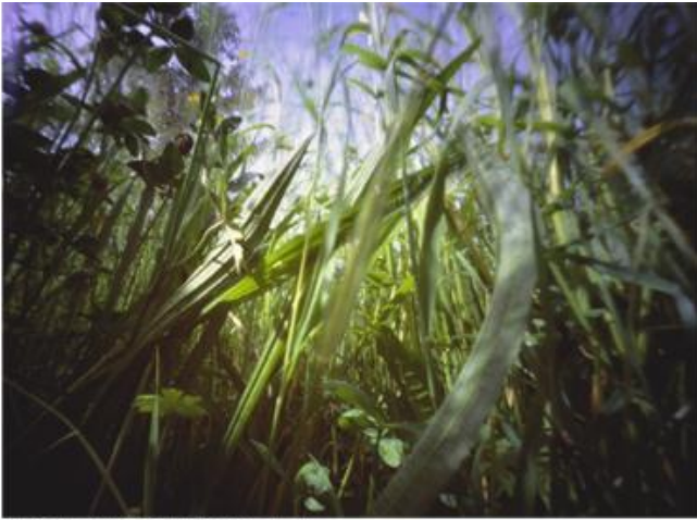
« Ronald Courchod : paysage » - paysage_urbain, vision subjective du jour - Photo de presse