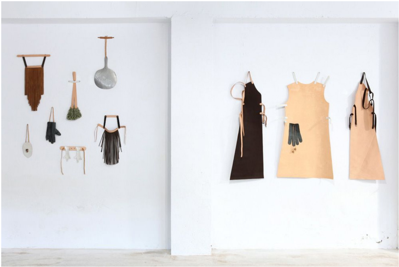
Cécile Falières, Mégier , 2022, installation, vue de l'exposition L'art et la rencontre 2 , Maison des Métiers du Cuir, Graulhet