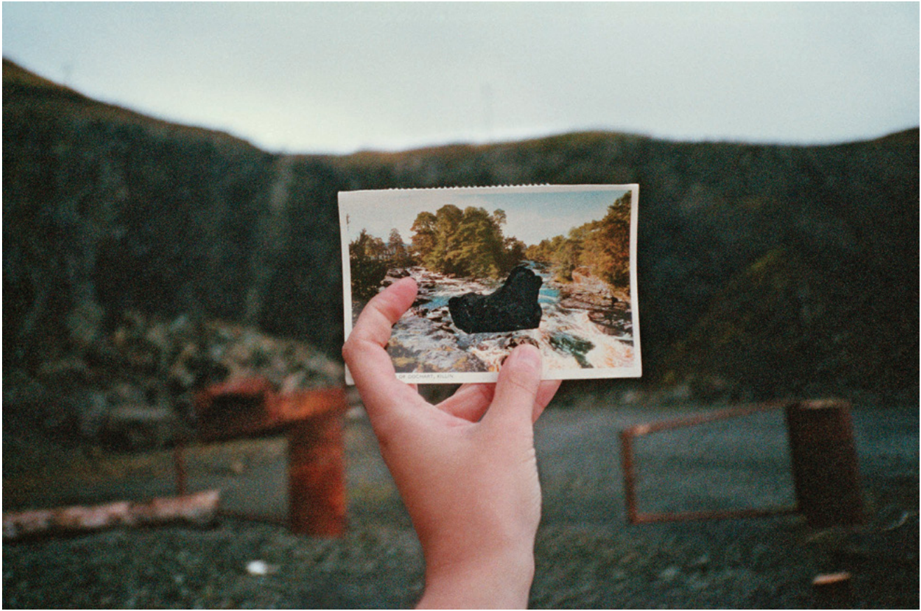
Célie Falières, Scenery , photographie argentique, 2018