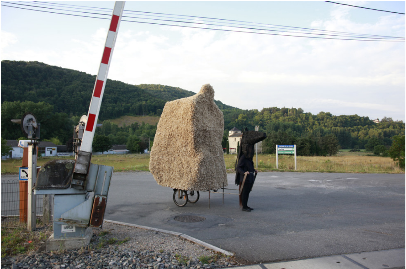
Célie Falières, Cavalcade , performance, 2020 © Célie Falières - photographie Delphine Gatinois