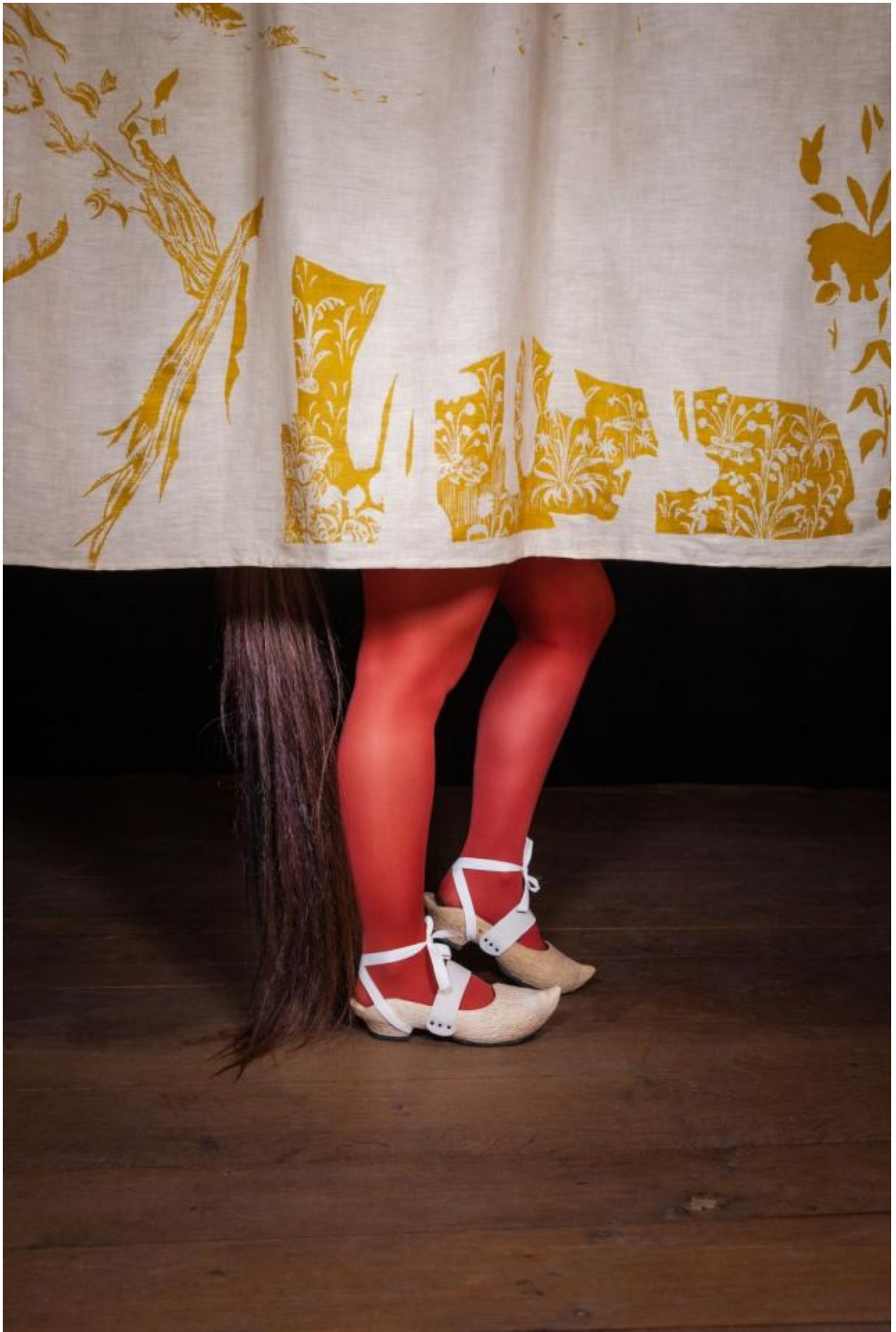
Célie Falières, Esclops , 2023, performance, Moulin des Arts de Saint-Rémy © Célie Falières - photo Lisa Gervassi