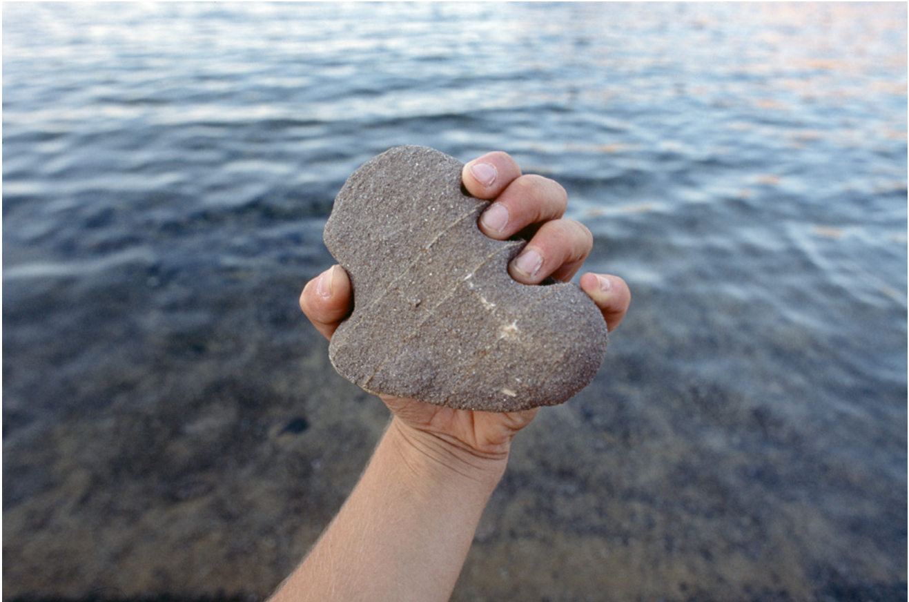
Célie Falières, Idiolecte , 2020, photographie numérique © Célie Falières